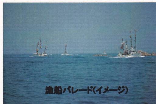
漁船パレード(イメージ)

(お問合せ先: 新潟県村上市勝木・交流の館八幡 はちまん 0254-60-5050)