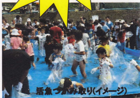
活魚つかみ取り(イメージ)

参加費: 2,500円 ・遊覧船にのって漁船パレード見学 ・活魚つかみ取り・漁師汁(1杯)付 (※一部行事に不参加の場合でも割引等はありません。)